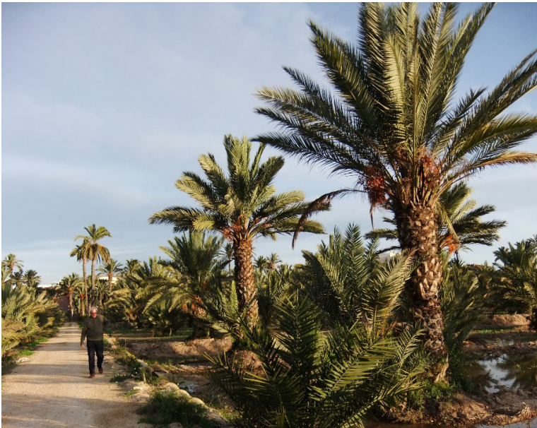
Colección varietal de palmeras del Hort del Gat en 2011

En la zona más al este del huerto se encuentra una parcela experimental de gran valor, pues se trata de una colección de palmeras datileras procedentes de multiplicación in vitro (vitroplantas) de 10 variedades diferentes, todas hembras y que producen un dátil de calidad.