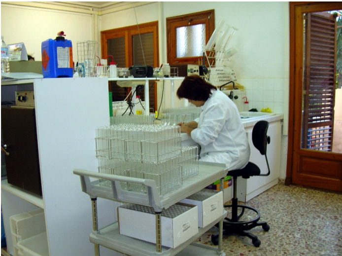
Laboratorio de la Estación Phoenix en 2005

Tras cerrar el Centro de Investigación Estación Phoenix y fracasar el proyecto del Instituto Tecnológico de la Palmera, no existe ningún centro donde se realicen las investigaciones que todo un patrimonio de la humanidad requiere.