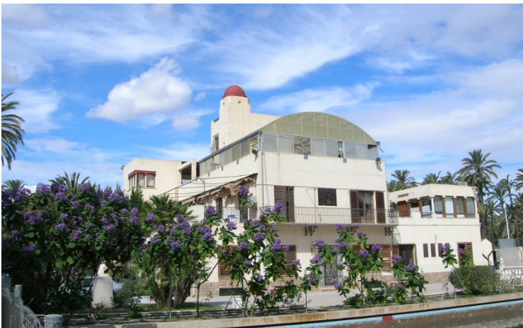
Casa del Hort del Gat en 2006

La casa tradicional del huerto fue derruida y en su lugar se construyó una nueva que fue diseñada en los sesenta por el arquitecto Antonio Serrano Peral, a partir de una concepción popular de la arquitectura con raíces arabizantes. Se trata de un inmueble de tipo señorial que cuenta con cerca de mil metros cuadrados de superficie dividido en dos plantas y sótanos, es un elemento arquitectónico de calidad que forma parte importante de la actual configuración del huerto.