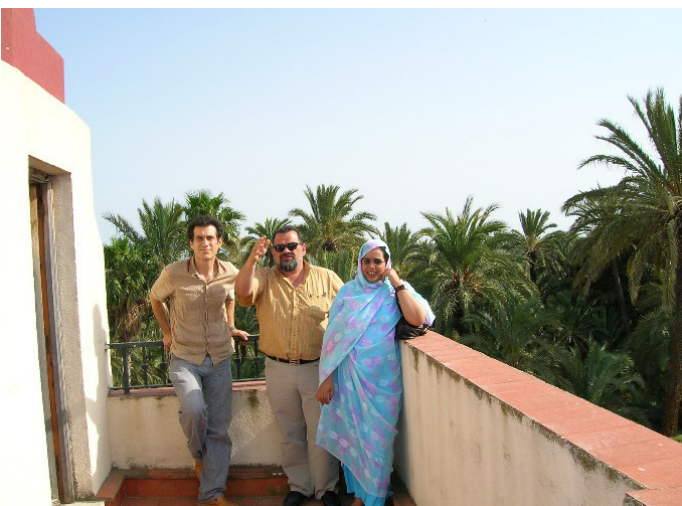
Mirador del Palmeral en el Hort del Gat, 2005

Planteamos, en concordancia y sin menoscabo del resto de actividades propuestas, que el Hort