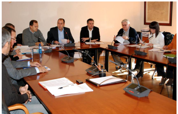
Reunión del Patronato del Palmeral, en el Ayuntamiento de Elche en 2010

Son buenas noticias, pero, para llevar a cabo una mejor gestión del Palmeral que la actual, es necesario ubicar y agrupar en un solo lugar los entes de gestión del mismo, como son el Gerente del Palmeral, el Patronato del Palmeral, la Concejalía del Palmeral y la de Medio Ambiente y las brigadas de mantenimiento y de vigilancia del Palmeral, ahora dispersos.