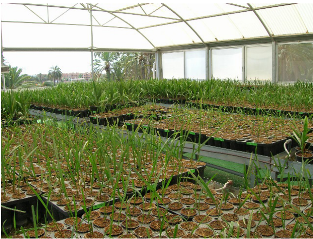
Producción de palmeras in vitro de la Estación Phoenix, 2005

Con una superficie de 59.651 m 2 , se encuentra en una zona privilegiada del Palmeral, en el Camí del Gat, donde se conservan muchos huertos de palmeras, en su mayoría privados, como el huerto de Avellán, el de la Rinconá, en los que se continúa con la tradición de la producción de palma blanca. También está cerca del famoso Jardín Huerto del Cura y del hotel del mismo nombre.