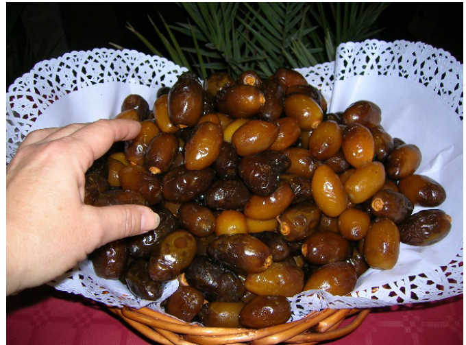
Dátiles producidos por las palmeras de la colección varietal