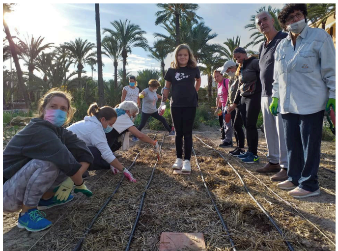
Hort de Felip, Curso de agricultura ecológica

Algunas de las parcelas del huerto se podrían reservar para actividades lúdicas relacionadas con la agricultura, la artesanía y el medio ambiente de alumnos de los centros de educación nombrados, así como para trabajar en la integración social de los ilicitanos del barrio de los Palmerales y de otros barrios que lo soliciten.