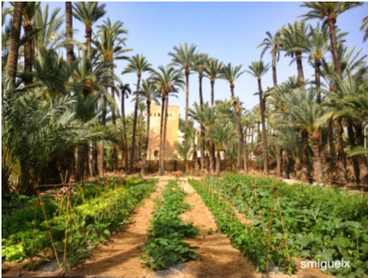
Huerto de la Veta, cultivado por los alumnos del IES la Torre de Elche

Es necesario para que la activación agrícola del huerto sea un referente para la apreciación del Palmeral como agrosistema vivo, visitable por los ilicitanos y turistas y para que el Hort del Gat se convierta en un ejemplo de un huerto de palmeras, herencia de la época andalusí.