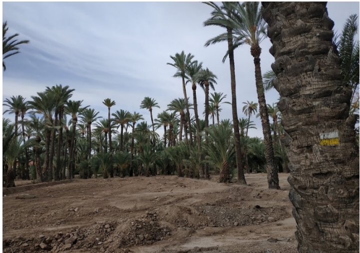
Estado actual de los bancales del Hort del Gat

Las parcelas están actualmente sin cultivar y son labradas regularmente, así como tratados con herbicidas los canales de agua.