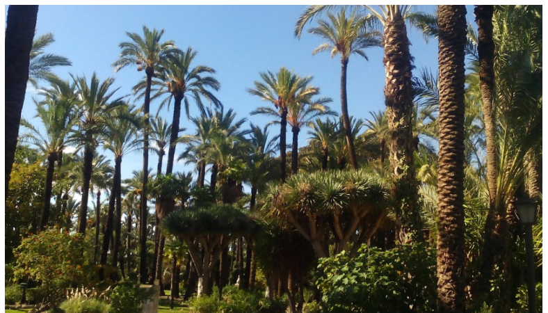
Zona ajardinada del Hort del Gat