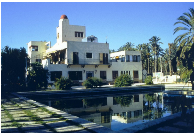
Vista de la casa desde la piscina en 1999