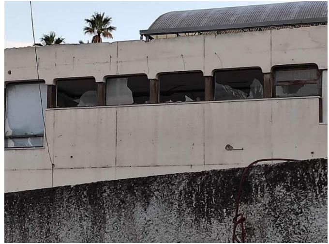
Estado actual del edificio

Desde Volem Palmerar consideramos que de realizarse esta cesión se cometería un error histórico y se desperdiciaría una oportunidad única para hacer de este huerto uno de los más auténticos y visitados del Palmeral ilicitano, para hacer de él, en suma, uno de los ejemplos de la Capitalidad Verde de Elche 2030.