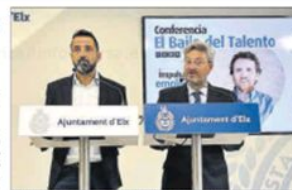
El edil de Promoción Económica y el gerente de L'Aljub.