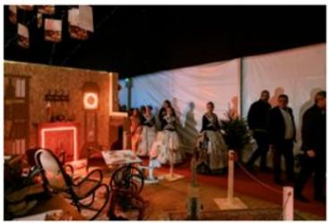
Las reinas y damas infantiles de las Fiestas de Elche fueron las encargadas del encendido oficial de Navidad

Diario de Alicante 20 de noviembre de 2023 ELCHE Tiempo estimado de lectura: 3 minutos